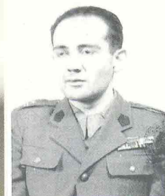
Bauman Zygmunt - 1925

Zygmunt Bauman era nato a Poznan nel 1925. Sopra, in divisa militare nel '53. A destra, con la moglie al Festival filosofia di Modena